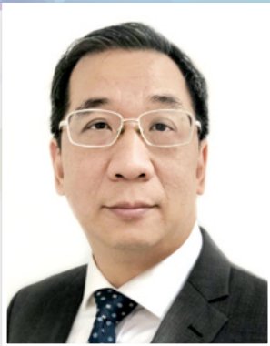
香港牙醫管理委員會主席 李健民牙科醫生